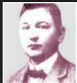
Hašek r. 1911