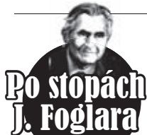
Po stopách J. Foglara